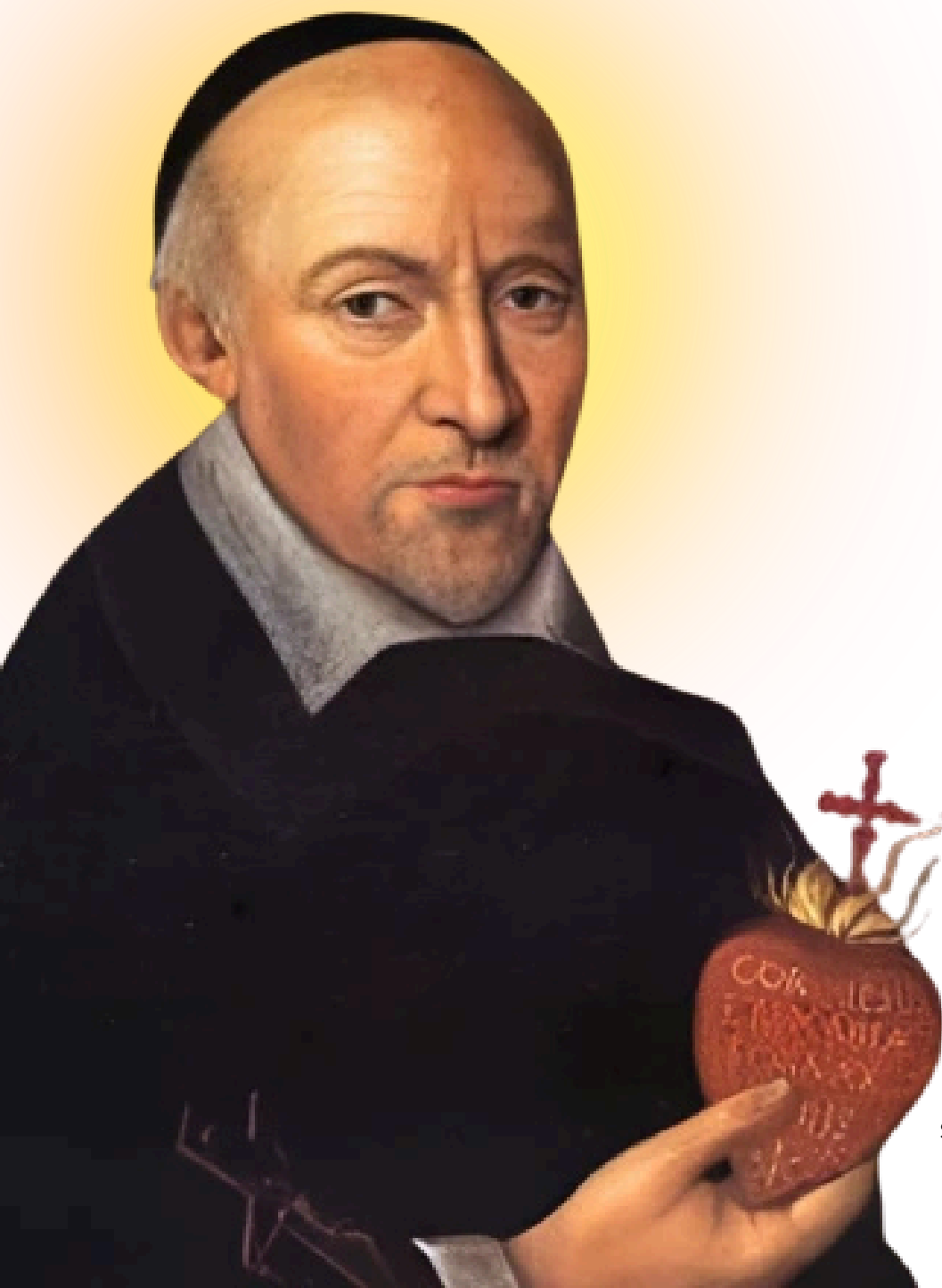
San Juan Eudes (1601-1680)