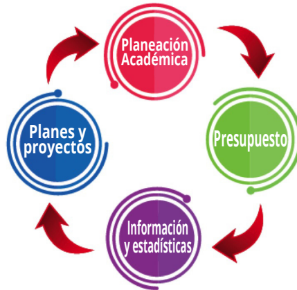
Figura 4. Campos de Acción Gerencia de Planeación y Desarrollo Institucional

Los campos de acción se presentan en la siguiente Figura: