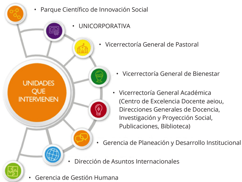
Figura 2. Unidades que intervienen en la ejecución del Plan de Desarrollo Profesional